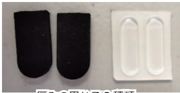
厚みの異なる2種類