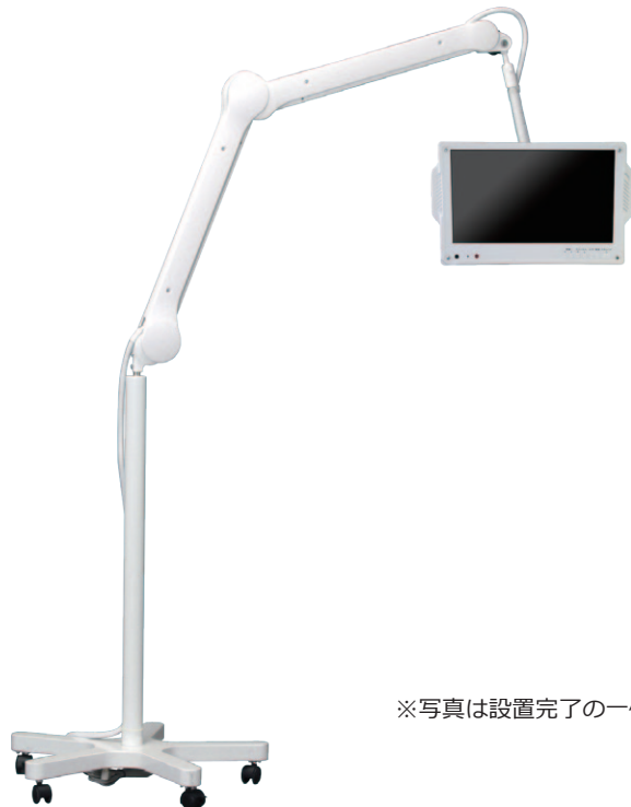
※写真は設置完了の一例です