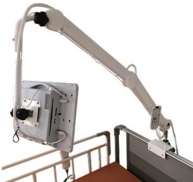
写真はピタッとアームで配線後の写真