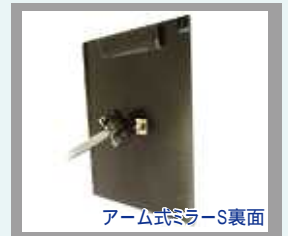
アーム式ミラーS裏面

Sクランプは横方向に取り付けることが出来ます。横からの取付ができるなら、このクランプはお勧めです。