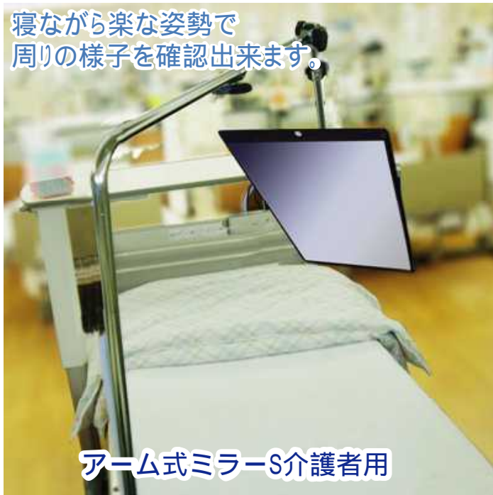
アーム式ミラーS介護者用

アーム式ミラーS介護用 [LG-AMS] 標準価格 13,000円 (税込価格)