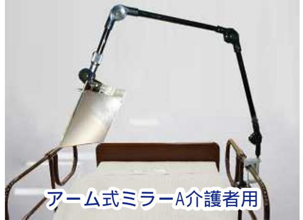
アーム式ミラーA介護者用

アーム式ミラーA介護用 [LG-AMA] 標準価格 10,000円 (税込価格)