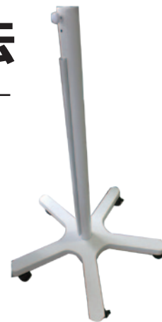
アーム用スタンド