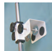
↑ 挟む部分 (上クランプ)