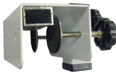
ホルダー用上クランプにスペーサーを加えた写真例