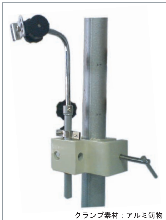
クランプ素材：アルミ鋳物