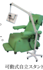
可動式自立スタンド

☆ 取付方法も豊富！ご入用に合わせてお選び頂けます。 ・ベッドへ取付(ベッドホルダー)・ベッド柵穴を利用 ・壁面・カウンター上面・可動式自立スタンド